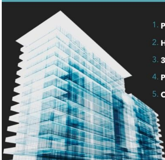
ГРАФИК РЕАЛИЗАЦИИ ИНВЕСТИЦИИ